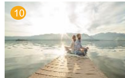
10 gezond leven