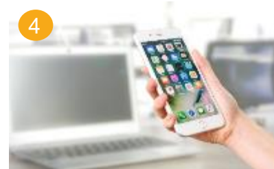
4 altijd verbonden