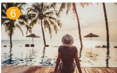
6 hang naar luxe