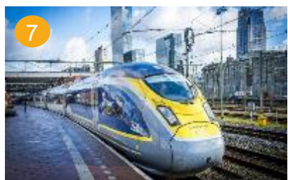
7 duurzaam op reis