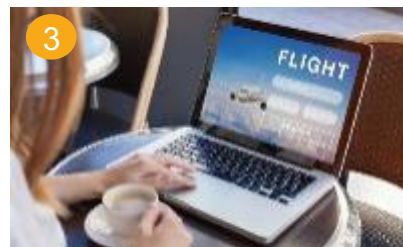
3 zelf vakantie samenstellen