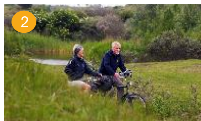
2 meer seniorenvakanties