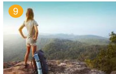
9 meer betekenisvol