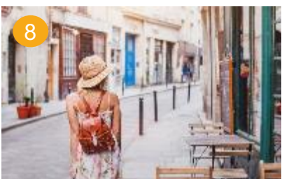
8 van de gebaande paden