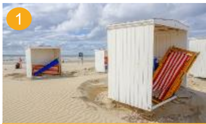
1 vaker kort op vakantie