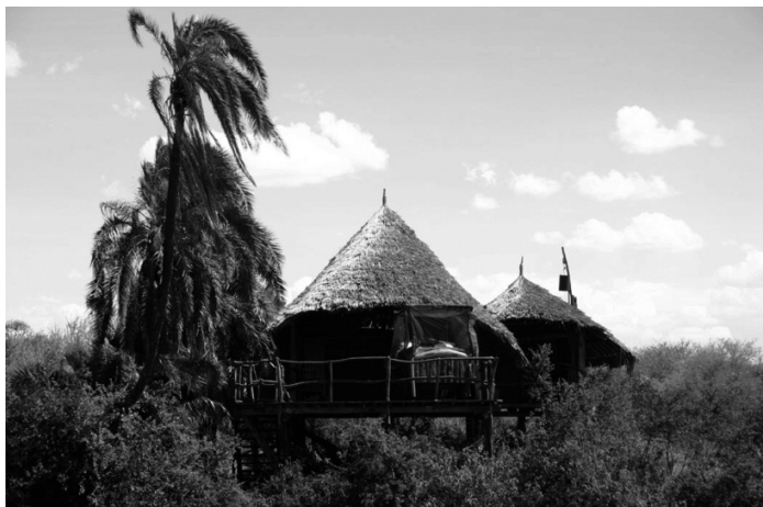
FIGUUR 2: De Koija Starbeds lodge

De Koija Starbeds lodge bestaat uit vier verhoogde houten platforms, gedeeltelijk overdekt door een rieten dak, en met een ruimte voor koffie, thee en lunches. De platforms hebben een ' Starbed ' dat in de openlucht kan worden gereden voor een nacht onder de sterren (zie Figuur 2). De replicatie van het Loisaba Starbed concept stelt de lokale bevolking in staat om te profiteren van de bestaande infrastructuur (bijv. wegen en landingsstrip voor vliegtuigjes), de managementervaring, de marketingkanalen, en het personeel van de particuliere ondernemer.